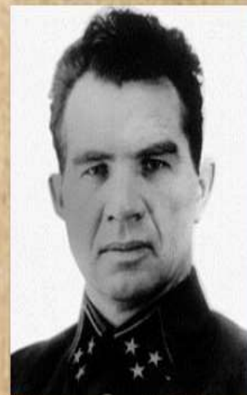
Чуйков Василий Иванович (1900-1982)

Маршал Советского Союза, дважды Герой Советского Союза